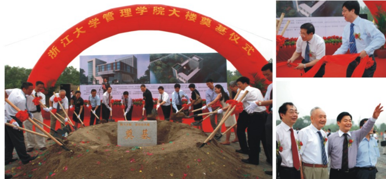
2011年5月21日，在浙江大学建校114周年之际，迎来了浙江大学管理学院大楼奠基的历史性时刻。

玉 内办公家具龙头企业浙江圣奥慈善基金会与管理学院签订协议，设立“浙江大学管理学院圣奥助学金”。根据协议，浙江圣奥慈善基金会将连续两年，每年向管院捐赠人民币五万元，资助管院经济困难，但品学兼优的本科生和研究生克服困难，顺利完成学业。学院还将组建“圣奥爱心社”，组织受助学生从事力所能及的社会公益活动，回报社会。