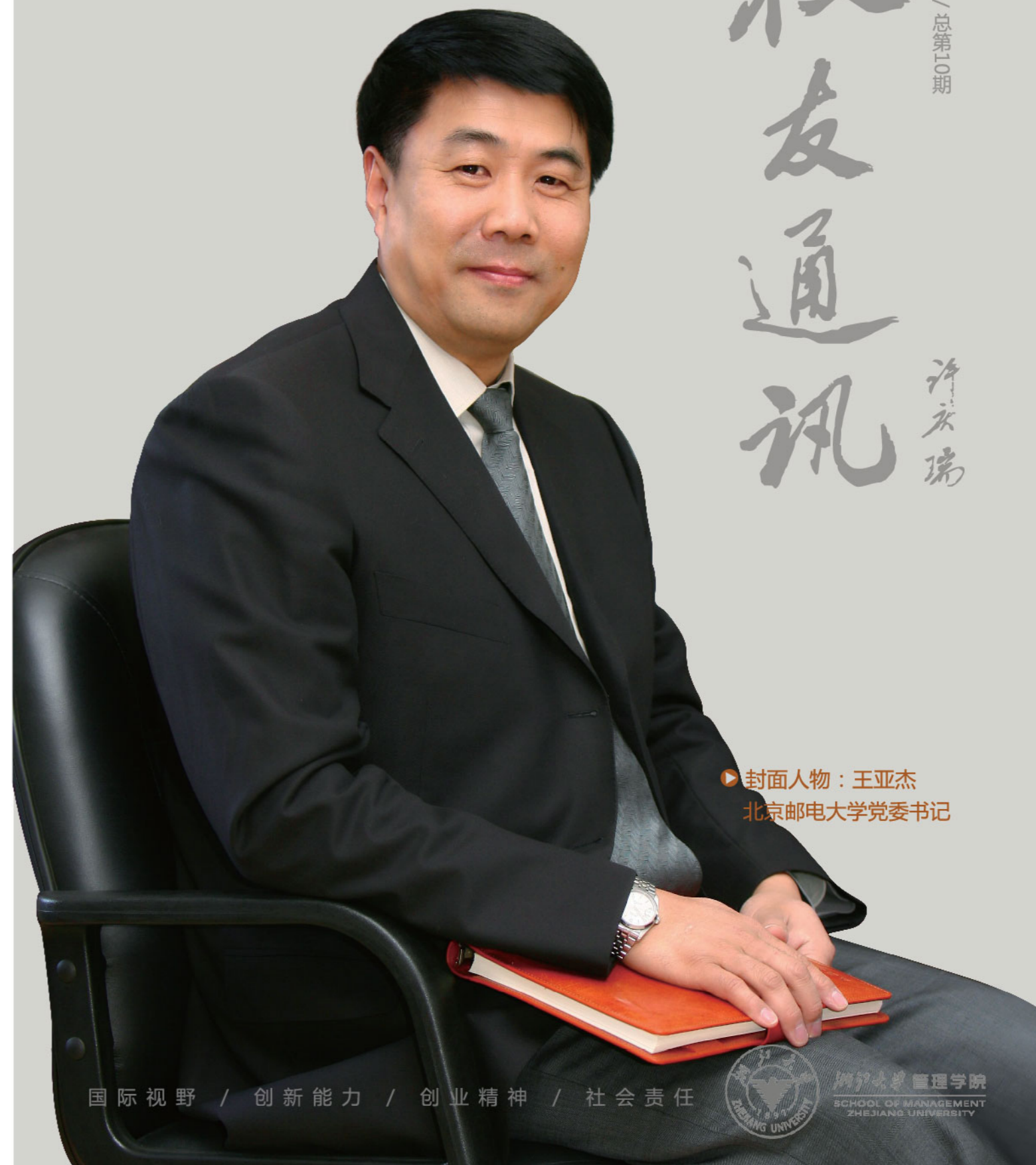
封面人物：王亚杰 北京邮电大学党委书记